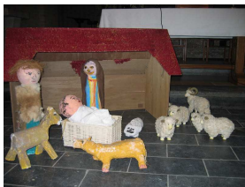
Kerststal VPKB-gemeente Leuven