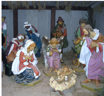
Kersstal Leuven (Grote Markt)